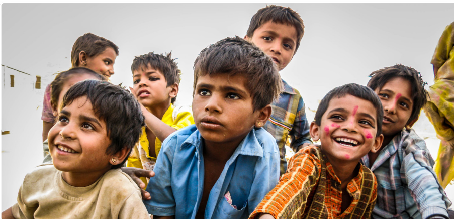
Szegény gyerekek Indiában