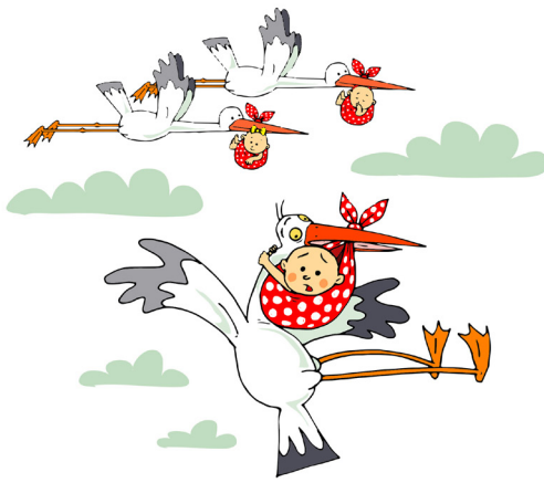
A jövő nemzedéke