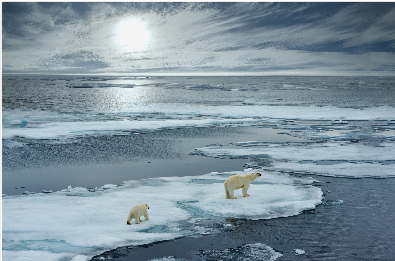
Olvadó jég a norvég sarkvidéken

A nemzetközi jogszabályok, egyezmények, irányelvek arra hivatottak, hogy fenntarthatósági kérdésekben (is) együttműködjenek az államok, hiszen a szennyezett víz vagy a klímaváltozás nem ismeri az országhatárokat.