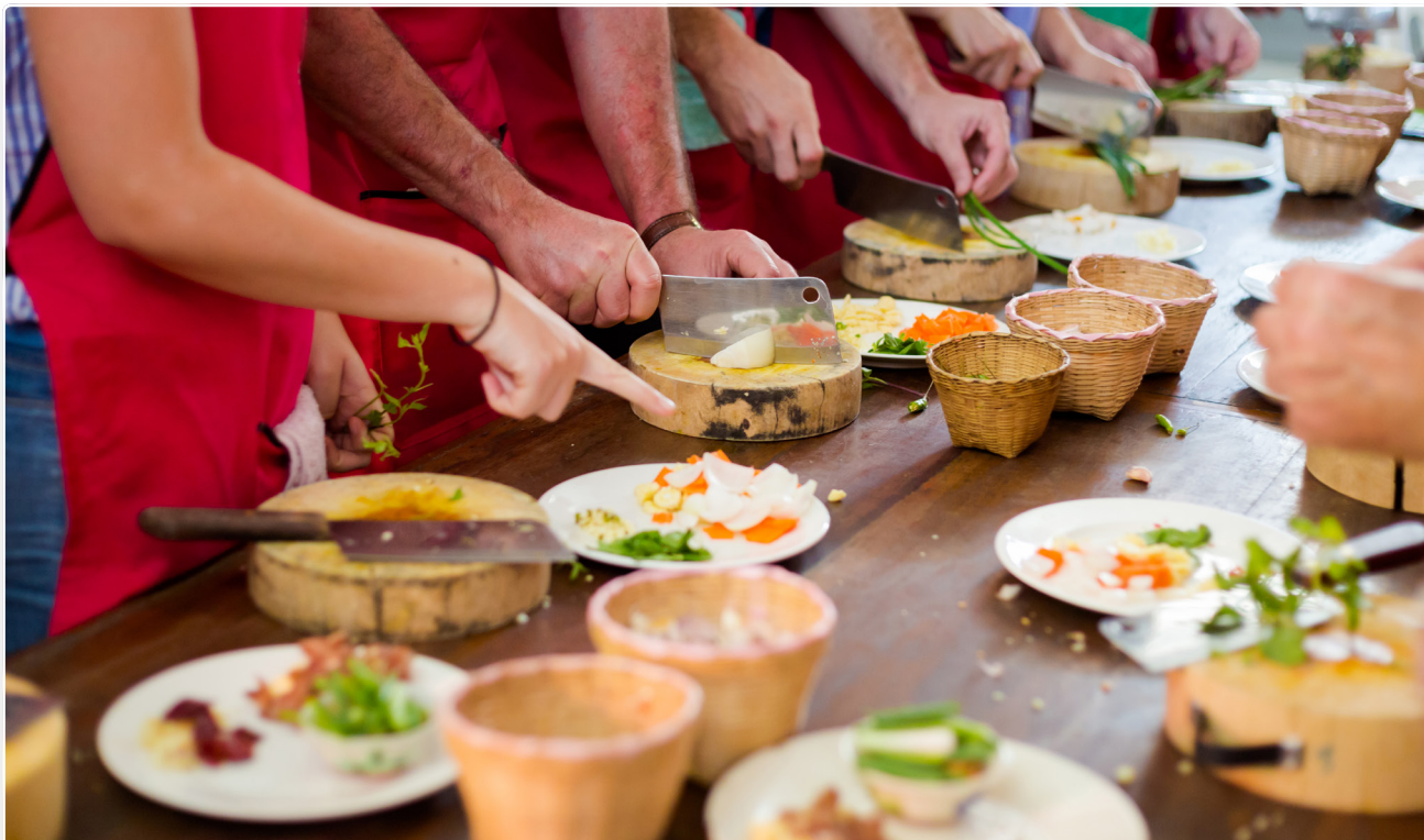
Közös főzés az iskolában

Az intézmény felvilágosító munkával, közösségépítéssel segítheti a gondok enyhítését. Ezek az intézmények részt vesznek a közösség életében, például különféle ünnepeken vagy bemutatókon, olyan támogatásokat vagy támogatási formákat alakíthatnak ki, ahol például: „jólléti piactérként” is működnek, lehetőséget és teret biztosíthatnak a használt gyermekruházat, játékok cseréjére, gyűjtésére, ezzel segítve egyrészt az újrahasznosítást, másrészt pedig etikus módon nyújtanak segítséget a rászorulóknak.