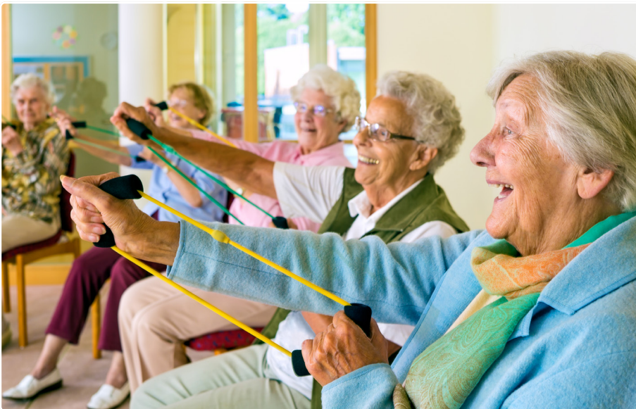
Foglalkozás az idősök otthonában

Mivel a dolgozók különböző szintereken és különböző területeken látják el a feladataikat, ez meglehetősen bonyolulttá teszi a fenntarthatósági szempontok érvényesítését.